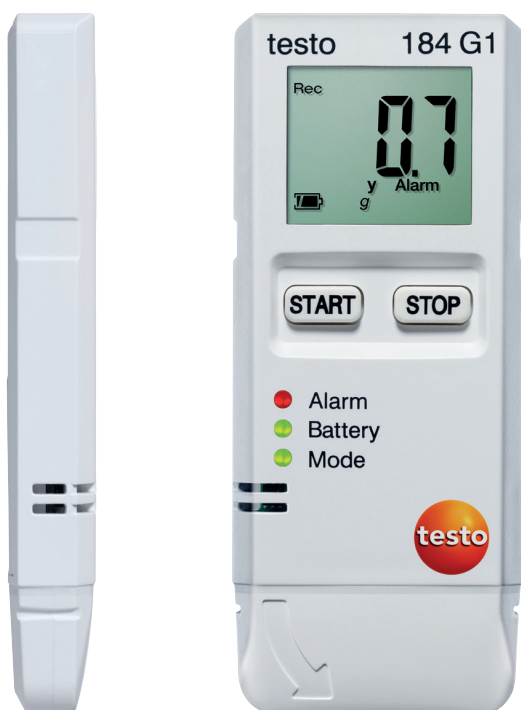
Zobrazení ve skutečné velikosti.

Přehled všech výhod záznamníku testo 184.