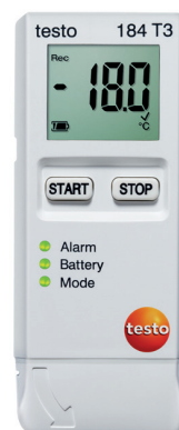
testo 184 T3