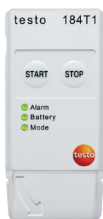
testo 184 T1